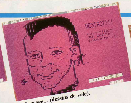
... Sauvage... (dessins de sole).