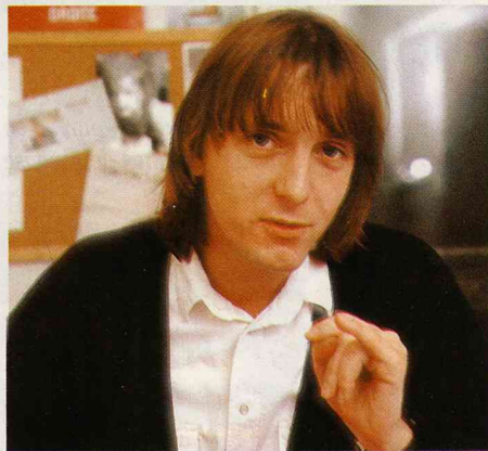
Vida chance (en verlan)