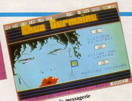
Page couleur de la messagerie

des partitions de ses morceaux avec les textes et les accords de guitare expliqués d'une façon simple.