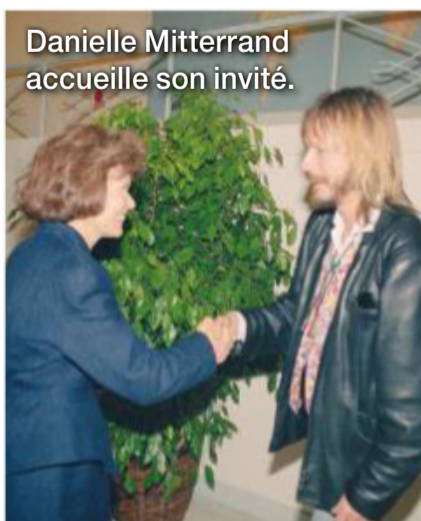
Danielle Mitterrand accueille son invité.