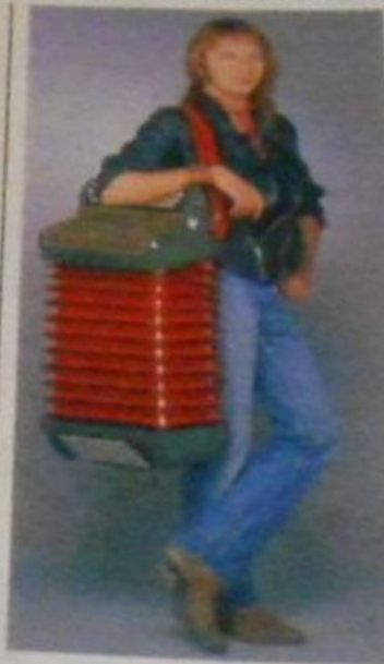
Renaud : nommé et maître de cérémonie de cette soirée dont Gilbert Bécaud est le président.

Nominations aux « Victoires de la musique 86 » : Meilleur artiste interprète masculin : Etienne Daho,