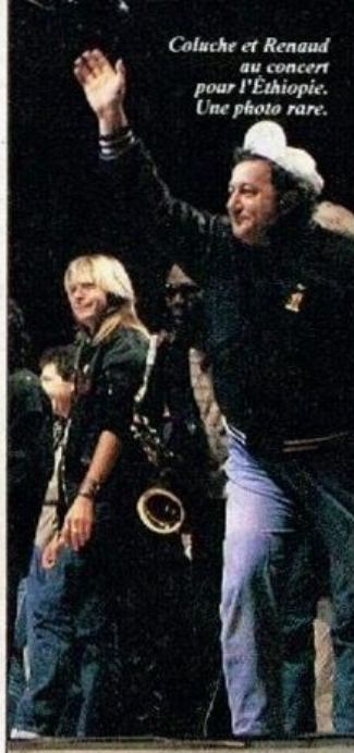
Coluche et Renaud au concert pour l'Éthiopie. Une photo rare.