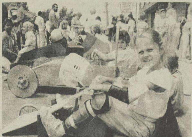
CONCOURS — La course des boîtes à beurre ne manque pas d'intérêt.