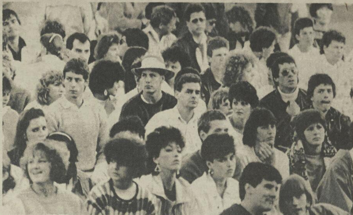
FOULE — La première activité de Festirame a attiré une foule considérable.

Après le départ à 13 heures aujourd'hui sur la rue Collard, des 55 tours cyclistes du Festirame, un spectacle comique sera