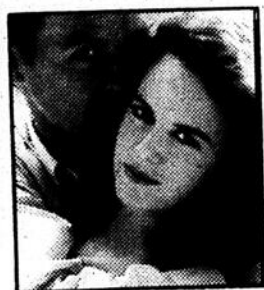
MICHAEL KEATON NICOLE KIDMAN

"10 SUR 10. UN PARFAIT MÉLANGE D'AMOUR, DE VALEURS FAMILIALES ET DE PARDON. L'UN DES MEILLEURS FILMS DE L'ANNÉE." G