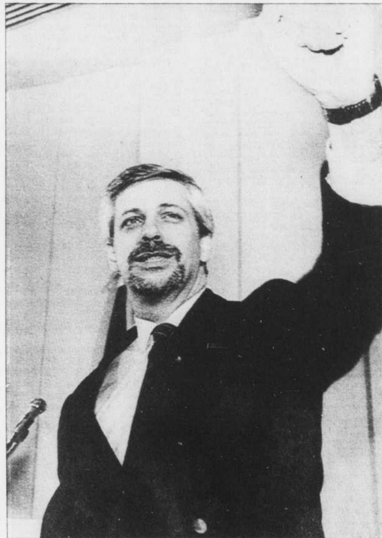
Le premier ministre avait un petit air triomphal samedi dernier: on venait de lui annoncer la remontée de son parti dans la faveur populaire.