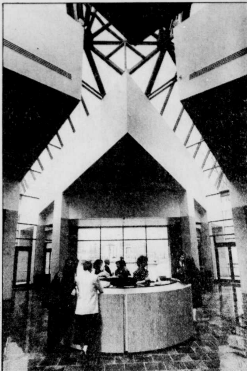
Les visiteurs accèdent au Musée du Québec par le Grand Hall, centre nerveux de l'institution. Au kiosque central, ils peuvent se procurer le dépliant sur la programmation des expositions et des activités d'animation.

□ un colloque sur l'art québécois et les perspectives internationales, en septembre.