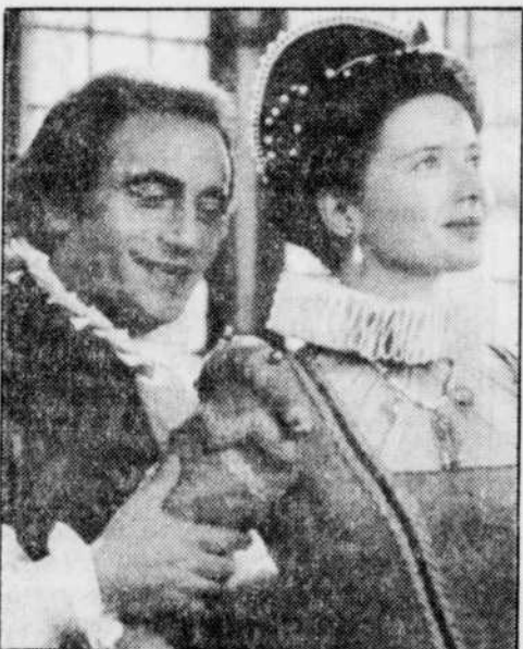
Un Brantôme par trop galant !

Le réalisateur français Jean Charles Tacchella s'en est donné à cœur joie (!) avec les aventures amoureuses du chevalier Brantôme. Trop c'est trop. page 3