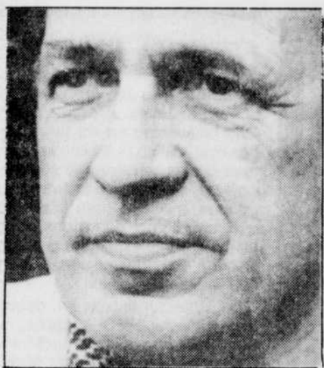
Pierre Boulez, prophète en son temps

Aussi bien comme compositeur que chef d'orchestre, Boulez a bousculé la tradition. Avec preuves à l'appui samedi prochain à Québec. page 11