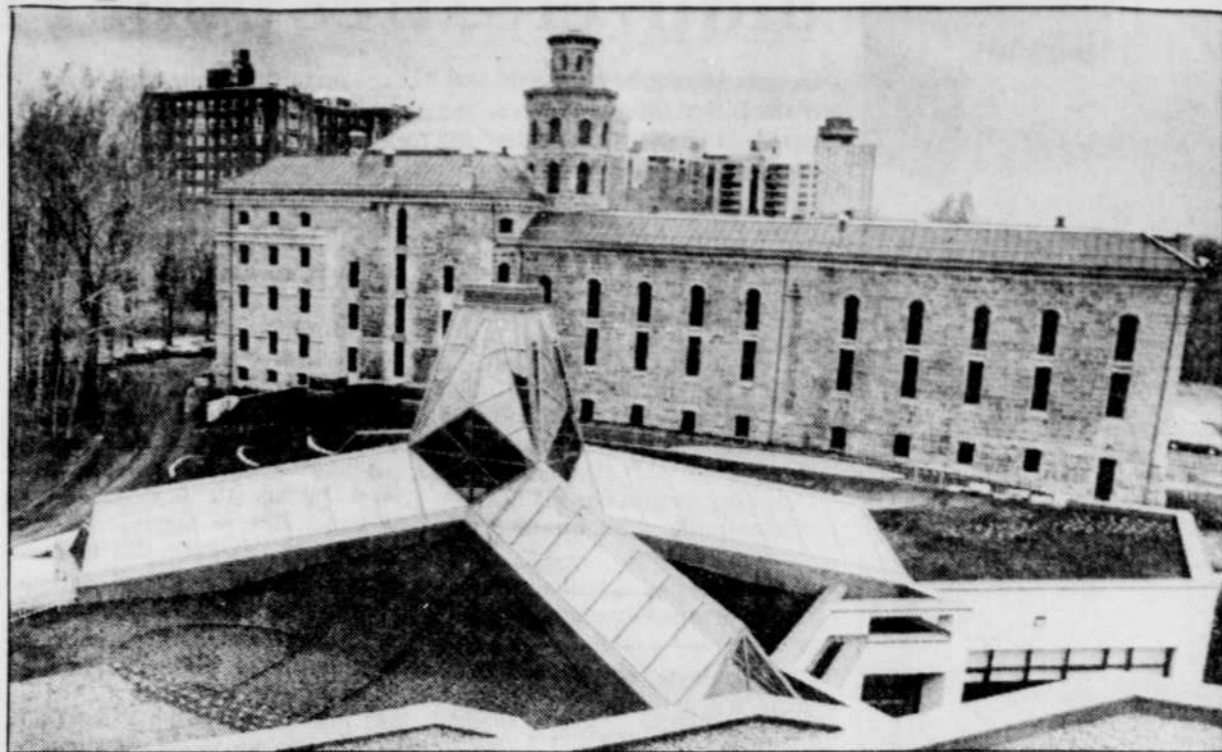
Le toit du Grand Hall, qui relie le pavillon Morisset au pavillon Baillargé (au fond), est partiellement tapissé de végétaux.

Musique, théâtre, mime (dont des tableaux vivants) sont quelques-unes des activités au programme, chacune étant conçue comme autant de clin d'oeil à la contribution de l'art à la vie sociale et individuelle. Et puis, y a-t-il quelque chose de plus ennuyant que de faire la file avant d'entrer?