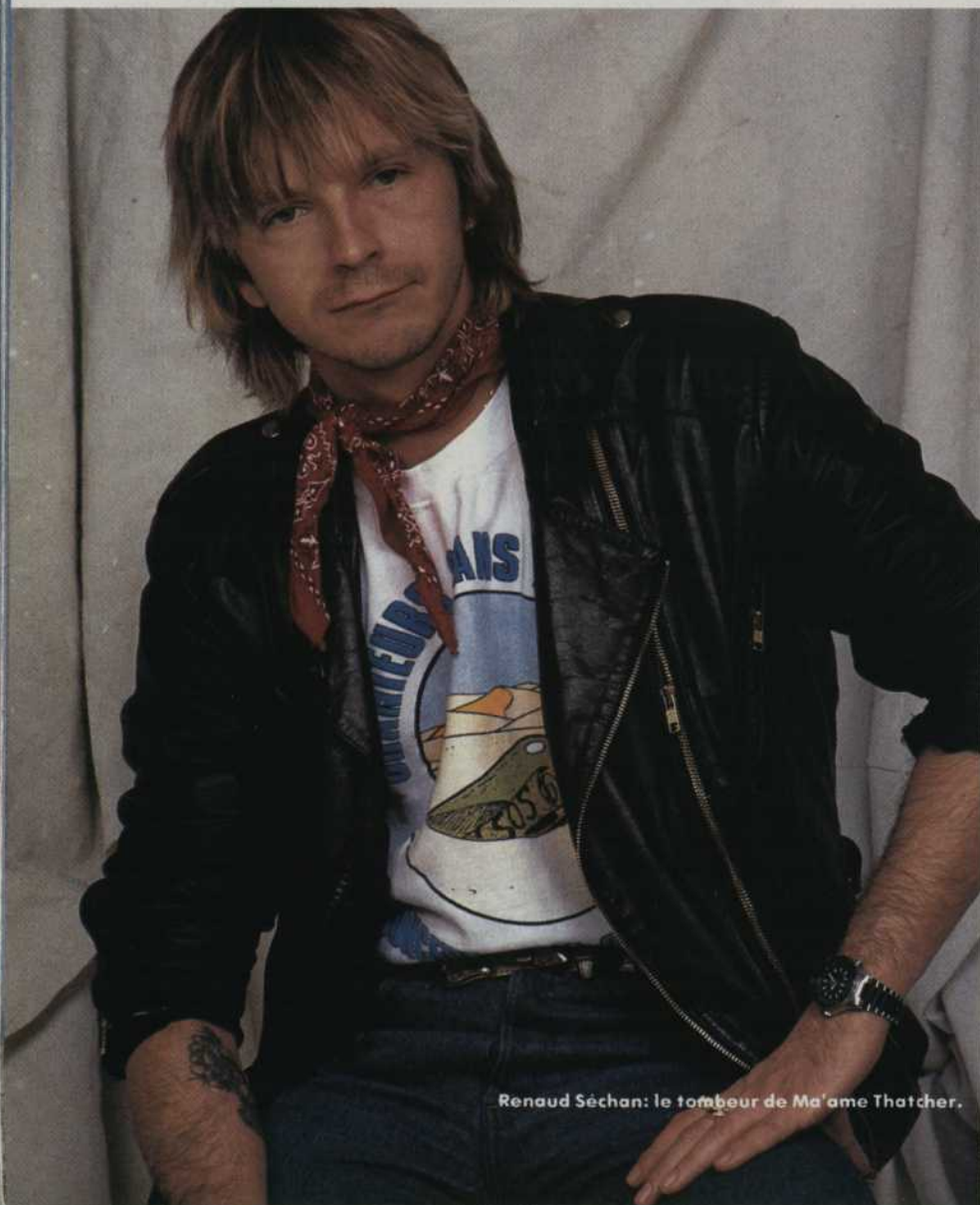
Renaud Séchan: le tombeur de Ma'ame Thatcher.