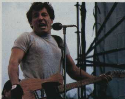
Bruce Springsteen: «L'histoire se souviendra et te remerciera».

«De retour à Paris, je me suis mis à écrire. Mistral Gagnant est le résultat de toute ma révolte... communiste-soviétique et autre.