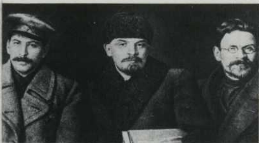
Staline, Lénine et Kamenev: on ne choisit jamais sa famille.

«Pour la pub? Pour l'instant, non. Dans le futur, peut-être. Il faudrait vraiment que ce soit un produit qui me branche. Et puis, une pub qui soit très drôle ou très belle. Il faudrait que j'aie besoin d'argent surtout (rires) Car c'est pas notre métier, c'est pas mon truc.