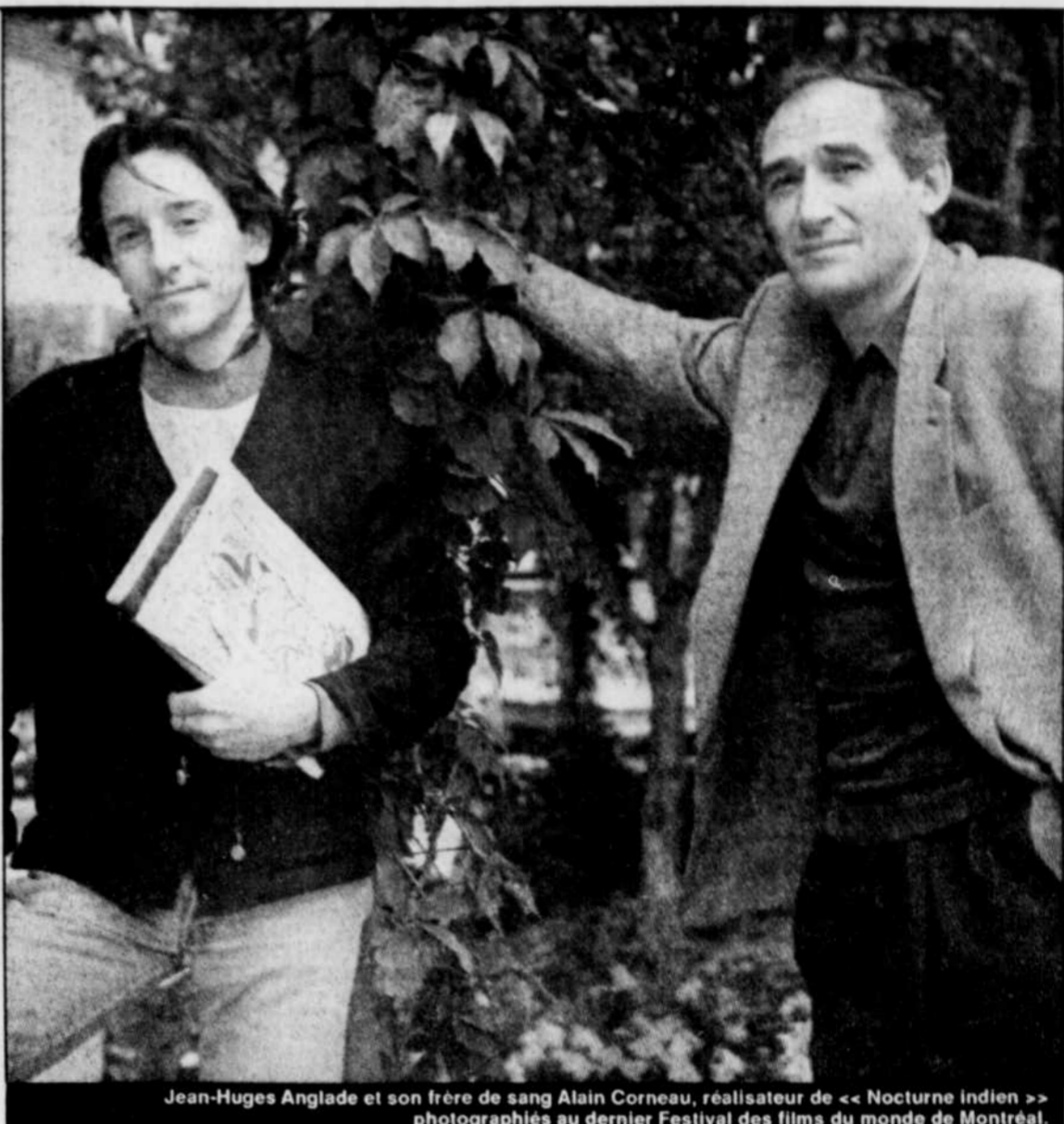
Jean-Hugues Anglade et son frère de sang Alain Corneau, réalisateur de « Nocturne indien », photographiés au dernier Festival des films du monde de Montréal.

Un peu comme à l'image de Rossignol (Jean-Hugues Anglade), le personnage principal de son film parti en Inde à la recherche d'un ami, le metteur en scène français pouvait enfin goûter aux fruits de la longue et inquiétante quête d'identité qu'il s'était imposée, en prenant le risque de tourner un film aussi singulier.