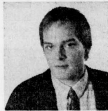
LOUIS LORTIE, pianiste