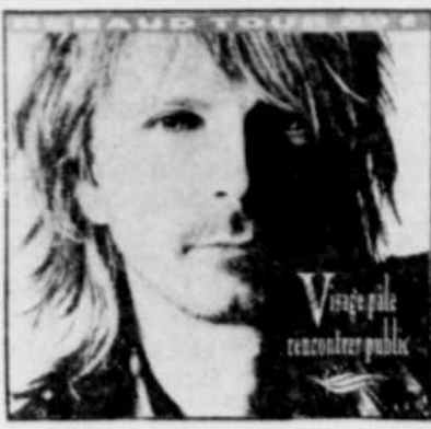
dites sur le disque, tandis que le mixage a été réalisé en partie au studio Marcadet de Paris.

En effet, son producteur, Guy Cloutier, a mis le paquet: Michel Rivard, Pierre Flynn, Jean-Pierre Ferland et même Charles Aznavour ont signé des chansons iné-