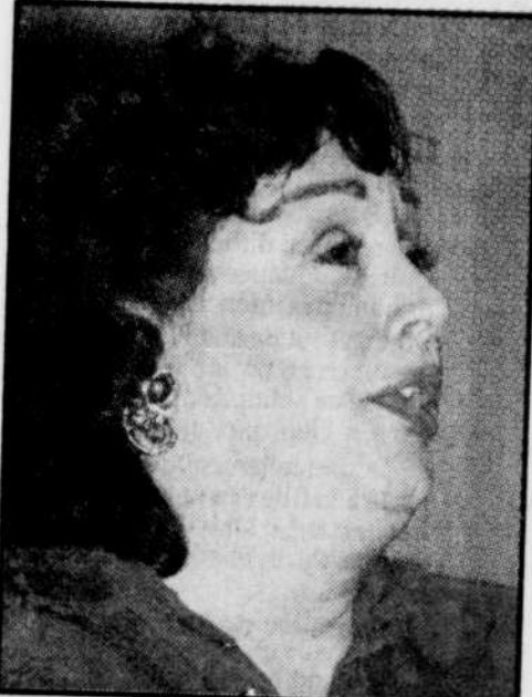
Françoise Pollet, la nouvelle diva française Un nouveau nom s'impose dans le domaine de l'art lyrique. Après l'Europe, Françoise Pollet entend la conquête de l'Amérique. page 5