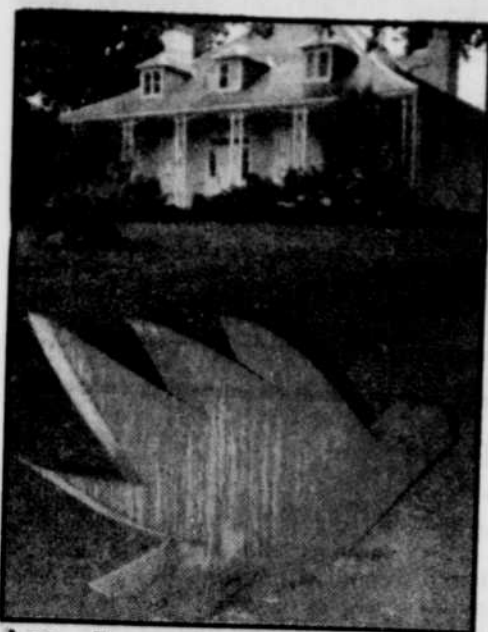
Les « Espaces privées » de la Maison Hamel-Bruneau Seize sculptures d'artistes québécois et canadiens, renommés ou en début de carrière, réunies dans un jardin des merveilles. page 4