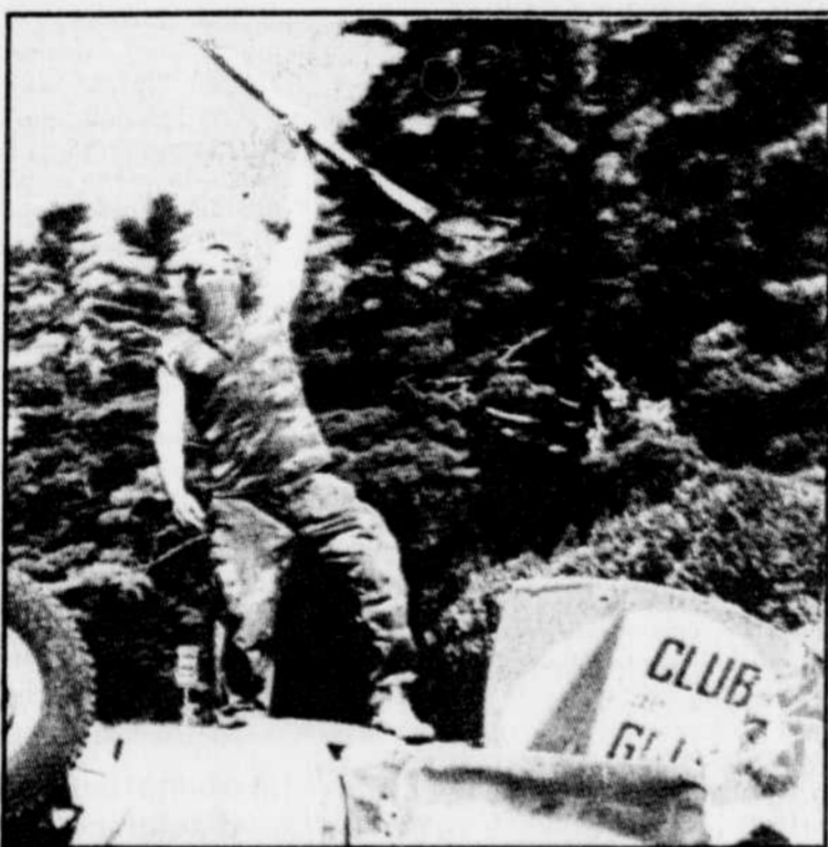
Au premier jour de la crise, les Mohawks prenaient possession de la pinède d'Oka et bravaient les autorités, comme ce Warrior juché sur un véhicule de la Sûreté du Québec renversé.