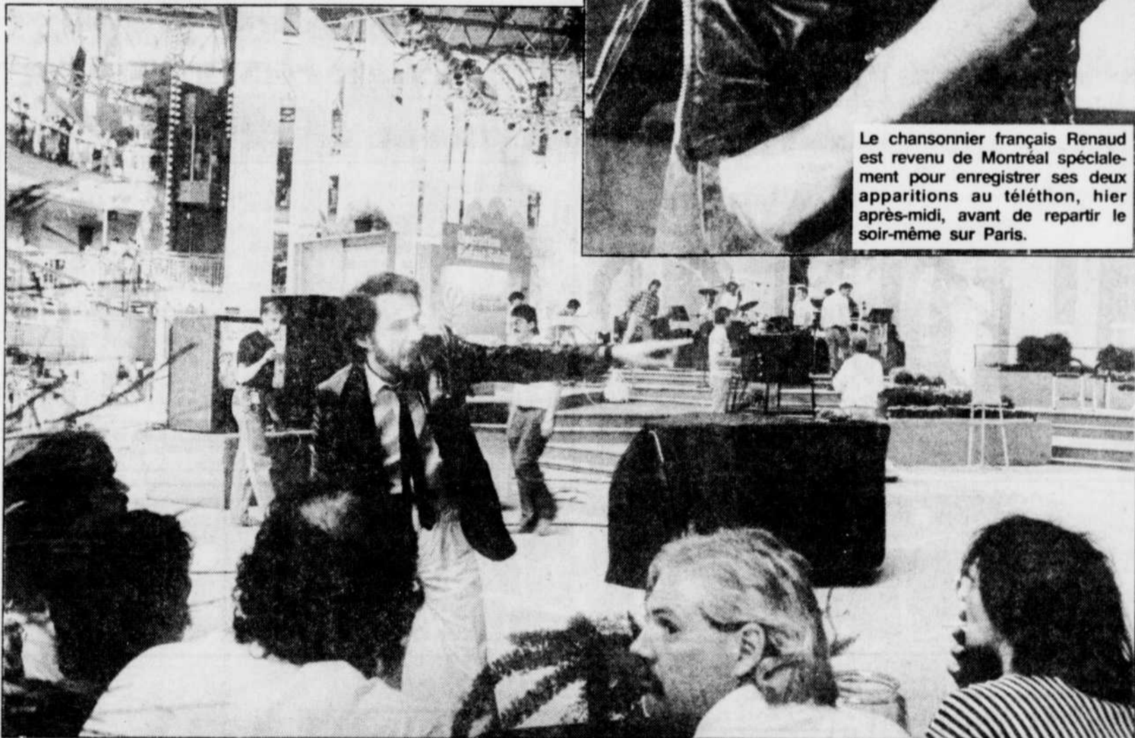
Séance de « briefing » des cameramen, durant les derniers préparatifs, hier après-midi, aux Galeries de la Capitale.