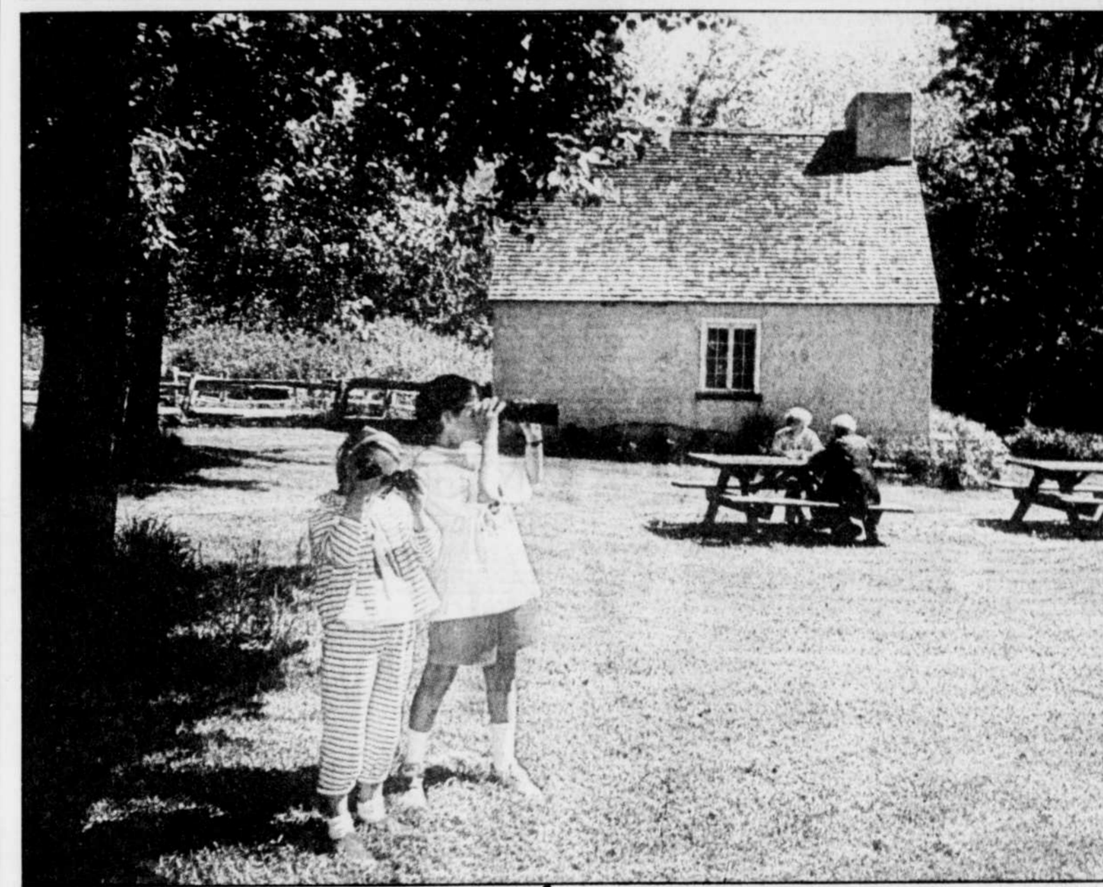
Pour souligner la semaine nationale consacrée à l'environnement, la Société linnéenne de Québec avait organisé hier une journée « porte ouverte » à la réserve nationale de la faune du cap Tourmente. Les amoureux de la nature pouvaient se promener librement dans les sentiers pédestres et découvrir, entre autres, une tour d'observation de plus de neuf mètres de haut dans les étangs aménagés pour la sauvagine.