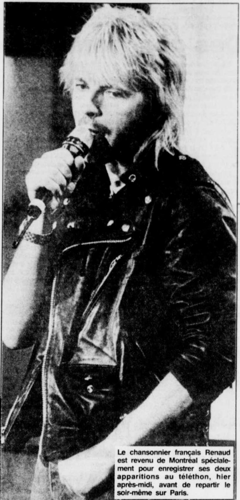
Le chansonnier français Renaud est revenu de Montréal spécialement pour enregistrer ses deux apparitions au téléthon, hier après-midi, avant de repartir le soir-même sur Paris.