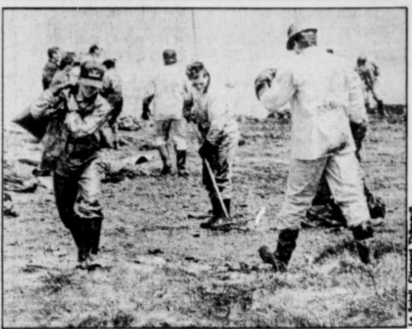
L'opération dépollution a coûté jusqu'ici un million de dollars.

tôt noire de leur avenir économique, écologique et touristique. Quant à l'habitat des oies blanches, on n'ose même pas en