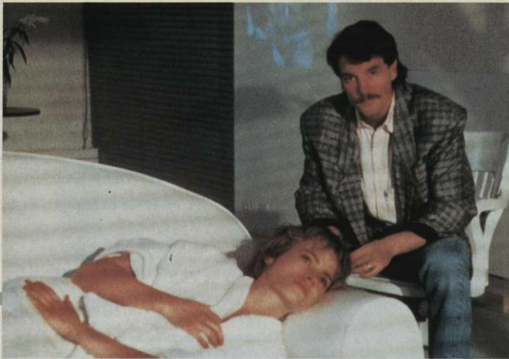
Le moins qu'on puisse dire, c'est que Cabrel ne correspond au profil du rocker-type: il ne boit pas, sa femme l'aime et, ô sacrilège, il a du succès.