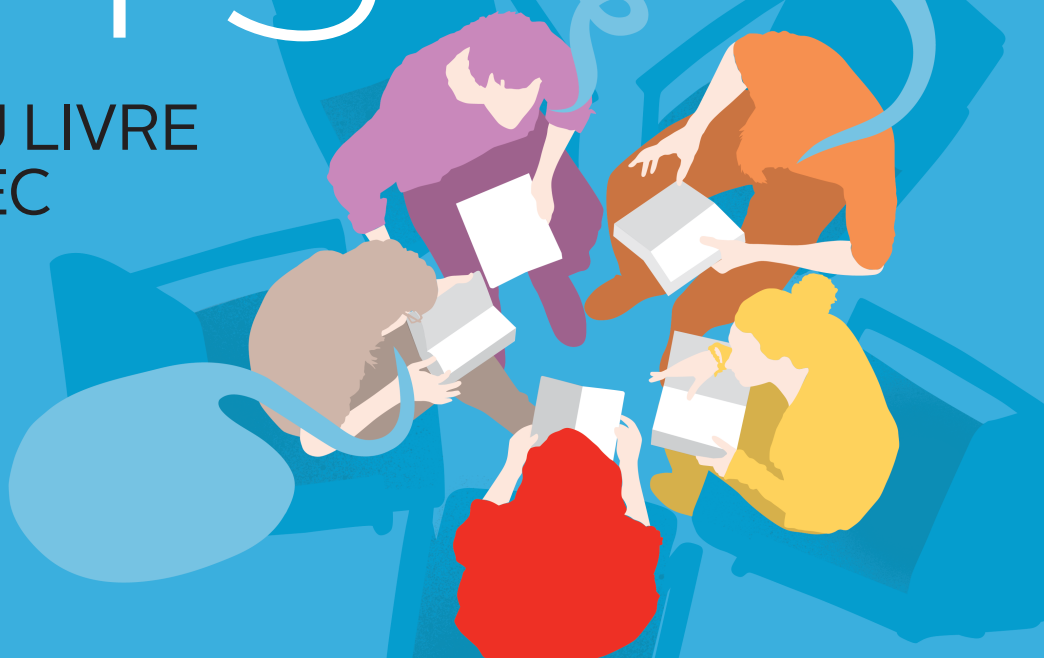
ILLUSTRATION LE SOLEIL