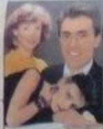
Jeanne Mas, Sabine Azema Gérard Holtz Trois des grands gagnants de l'année 1985.