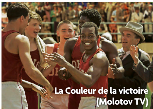
La Couleur de la victoire (Molotov TV)

Notes encarts : Ce numéro comporte les éditions régionales brochées au centre destinées à une partie des kiosques et/ou des abonnés.