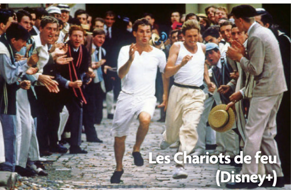
Les Chariots de feu (Disney+)