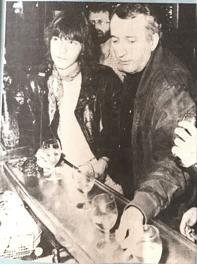
Renaud tel qu'en lui-même