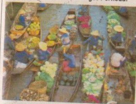
Bangkok : un rêve qui s'effrite.