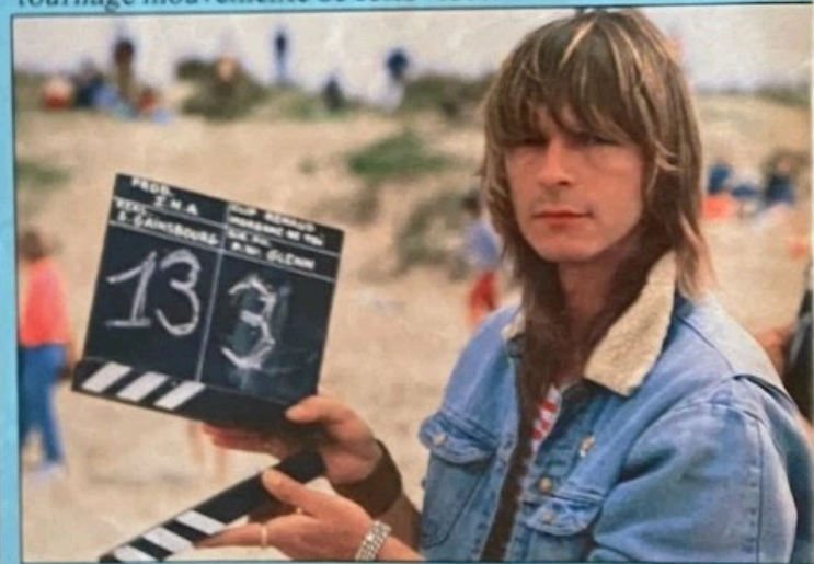
« Morgane de toi ». Attention ça tourne. Envoyez le play-back. Partez.