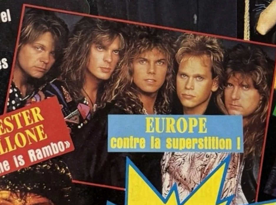
EUROPE contre la superstition !