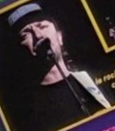
Soldat Louis et le rock breton. Ça déménage comme une tempête !