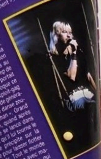
Après une petite pause sur le banc, tout sur la balançoire.